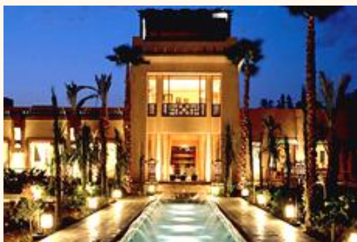
Le Meridien N'Fis Hotel ご利用 9日間