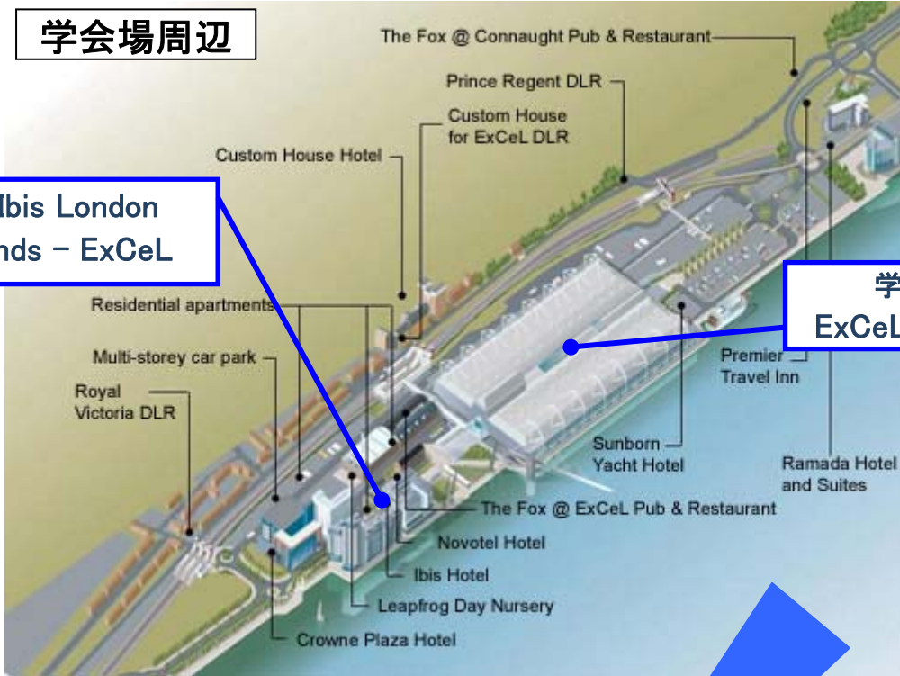
Travel Time by Tube to ExCel