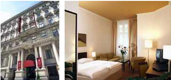
(外観) (お部屋の一例)

市内中心部、ウィーン大学や市庁舎の近くに位置するホテル。白い外壁のクラシックな建物。廊下も古い美術館の様な雰囲気。客室はモダンな雰囲気、薄いグレーのファブリックで上品にまとめられている。地下鉄ラートハウス駅から徒歩約4分、ショットンターア駅から徒歩約5分。