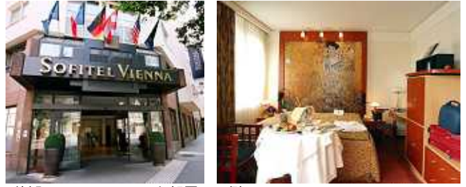
(外観) (お部屋の一例)

歴史的な街ウィーンの中心部に建つホテル。ウィーン中央駅までは車で数分。国立オペラ劇場、音楽家達の像が立つ市立公園に近い。ウィーン国際空港からの交通の便も良い。