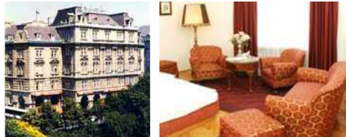
(外観) (お部屋の一例)

地下鉄ショットンターア駅の近くに位置するホテル。19世紀後半創業の歴史あるホテルで、そのクラシカルな外観にも趣がある。由緒ある教会や大学などにも近い。ウィーン国際空港から約30km。