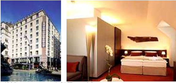
(外観) (お部屋の一例)

ケルトナー通りとドンナー噴水の間に建つホテル。ロビーはシンプルな造りで明るい雰囲気。客室は白を基調に赤や青といった原色を取り入れた鮮やかな色彩とモダンなデザインのインテリアが印象的。周辺にはシュテファン寺院や国立オペラ座があり、観光にも便利なロケーション。