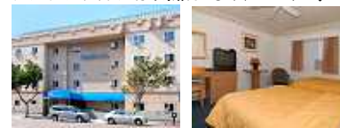
(ホテル外観) (お部屋の一例)

市内中心部、ホートンプラザの東側近くに位置するホテル。ベージュ色の外観。客室は全室電子レンジと冷蔵庫付きで、インテリアはシンプルだが気兼ねなくつるげる。