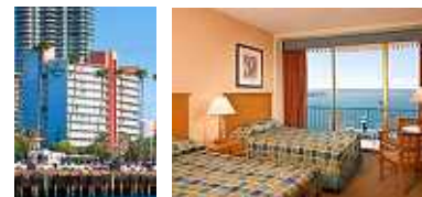
(ホテル外観) (お部屋の一例)

市内ベイエリアに位置するホテル。すべての部屋にバルコニーが設置されており、湾の眺望を満喫できる。人々で賑わうシーポート・ビレッジへも約 1.5km と近く、ビジネスにもショッピングにも便利。