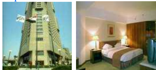
(外観) (お部屋の一例)

市内中心部、ナイル川を望む一等地に建つ大型ホテル。両脇に独特の凹凸感がある高層の建物は市内でもランドマーク的な存在。客室にはダークウッドの家具が配され、エレガントで落ち着いた雰囲気を演出している。最上階のバーからの眺めは素晴らしいと評判。考古学博物館までは徒歩約5分。カイロ国際空港から約24km。学会場へはシャトルバスが運行されます。