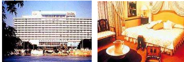
(外観) (お部屋の一例)

市内中心部のナイル川沿い、博物館に隣接して建つホテル。表面にわずかに屈折のある白い建物。客室はほのかにこの地方らしさを感じるインテリア。バラエティに富んだ飲食施設を有しているほか、館内にカジノもある。カイロ国際空港から約21km。学会場へはシャトルバスが運行されます。